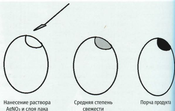
Рис. 1. Нанесение индикатора свежести яиц

Решение проблемы определения реальной степени свежести продуктов питания видится в создании индикаторов свежести, которые постоянно хранятся и взаимодействуют с продуктом. Появляются так называемые