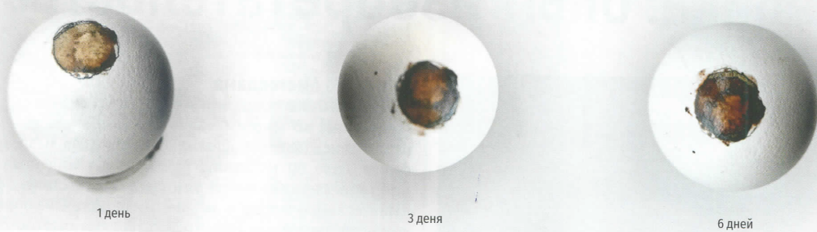
Рис. 2. Изменения индикатора при хранении яйца при комнатной температуре

че. Среди таких соединений углекислый газ, летучие соединения азота, биогенные амины, сероводород, спирт, глюкоза, органические кислоты. При достижении определенной концентрации одного из этих веществ цвет индикатора меняется, что и сигнализирует о порче.